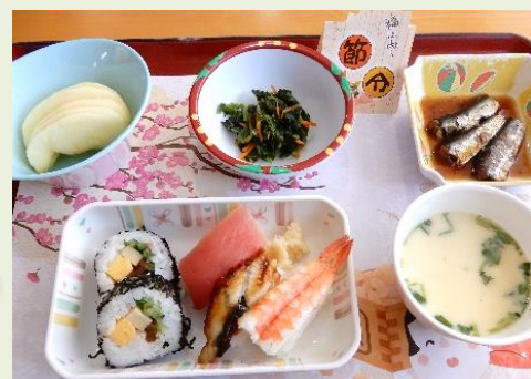
昼食は節分メニューでした♪