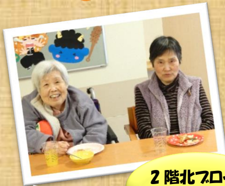
2階北フロック おやつPARTY