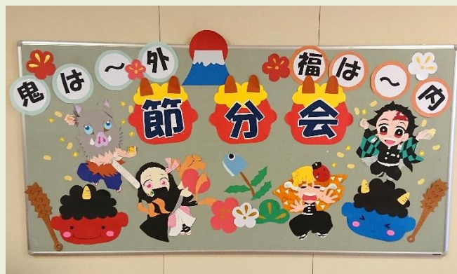
2階北ブロックの装飾

2月2日(火)節分会を行いました。職員扮する鬼に玉を投げつけ、無事追い払う事が出来ました。「鬼は外〜福は内〜」と元気な声が響いていました♪