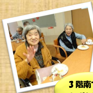
3階南フロック にぎわい喫茶