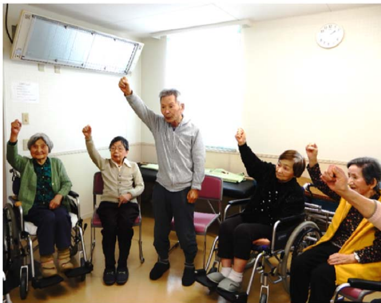
これからステージに向かいます。