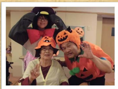
ハッピーハロウィン