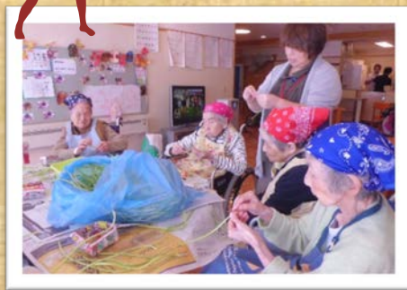
サツマイモのつるで金平作り