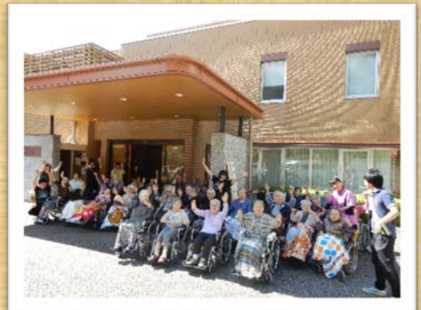
もうすぐお神輿がやってきます