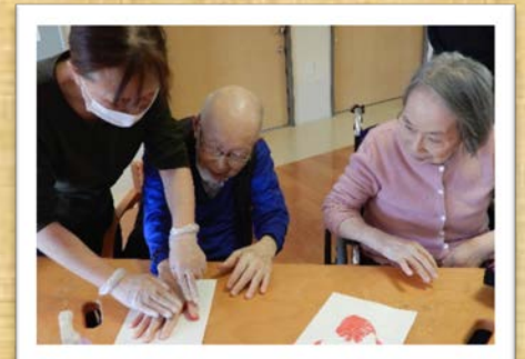
手形で紅葉柄を作りました