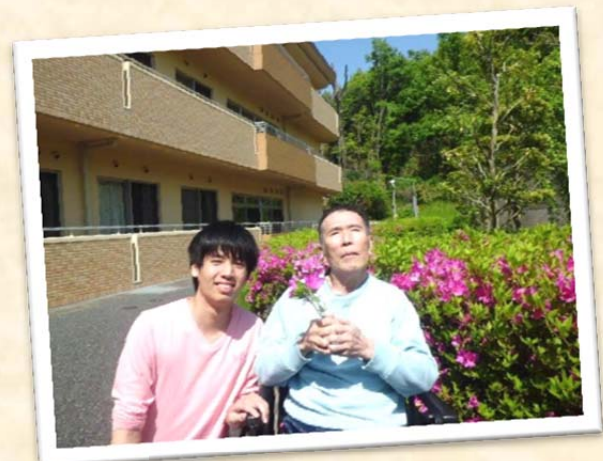
また一緒に散歩しましょうね!