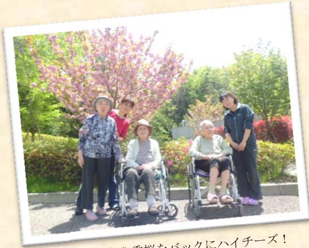
見事な八重桜をバックにハイチーズ!