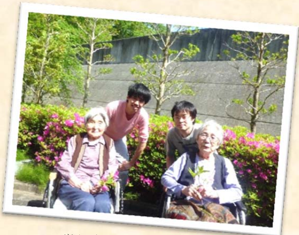
ツツジが綺麗に咲いてました!