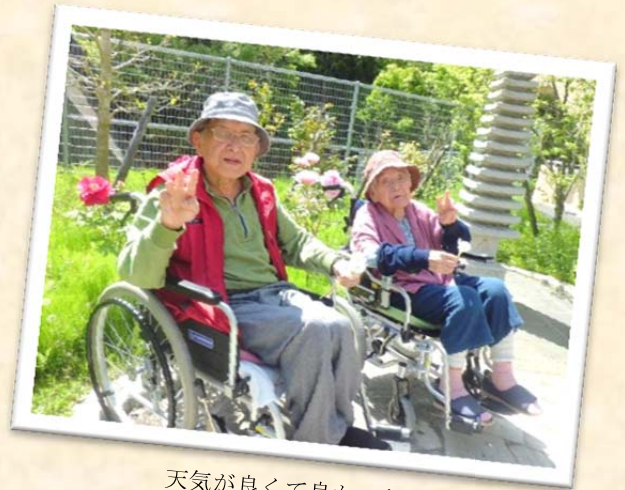
天気が良くて良かったー!