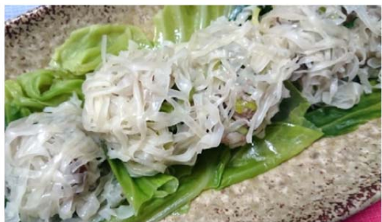
1人分 313kcal たんぱく質 20g 塩分 1.2g

目先が変わったしゅうまいで、皮の食感と具材の食感を楽しめます。また、一緒に蒸したキャベツの味も格別です。キャベツには骨や胃腸を強くするビタミンがたっぷり含まれ、豚肉との相性も抜群です。