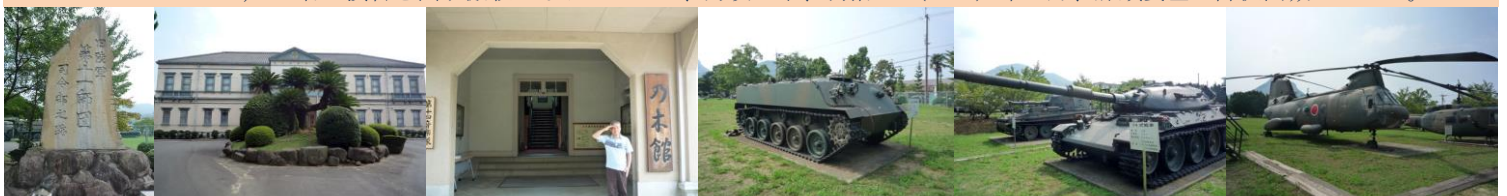
旧陸軍第11師団司令部跡(現陸上自衛隊第14旅団)

ところで、旧陸軍第11師団の名が広く知れ渡ったのは日露戦争で、東京第1師団・金沢第9師団とともに乃木希典大將率いる旅順要塞攻略に向かった第3軍の基幹師団として激闘を繰り返しました。ご案内のように旅順攻撃は日露戦争自体の趨勢を決める重要な局地戦となりました。堅固な近代的要塞への攻撃で乃木軍は戦死者約16,000名、戦傷者約44,000名の損害を出す激戦となりましたが、力攻の末、明治38(1904)年1月、旅順要塞は降伏開城しました。