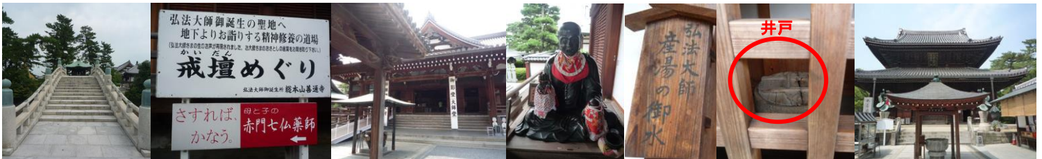
境内へとかかる橋